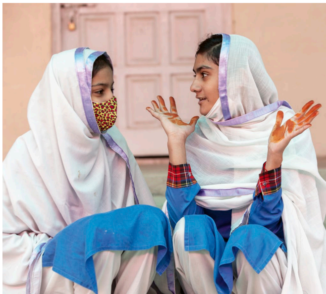
Alumnas en Pakistán

En este contexto, en 2016, el Ministerio Federal de Cooperación Económica y Desarrollo de Alemania (BMZ) encargó a Sanitation for Millions la mejora del acceso a un saneamiento e higiene seguros, centrándose en los grupos desfavorecidos y vulnerables. Alrededor de dos millones de personas se han beneficiado directamente de las medidas del proyecto.