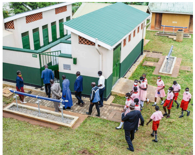
Entrega de baños con instalaciones para el lavado de manos en una escuela en Uganda