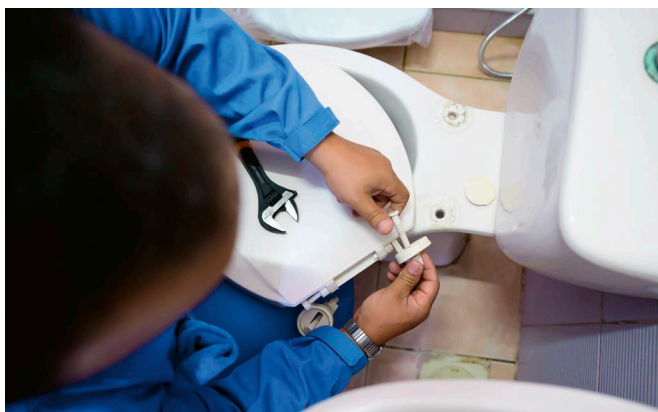
Formación en fontanería en un orfanato en Jordania