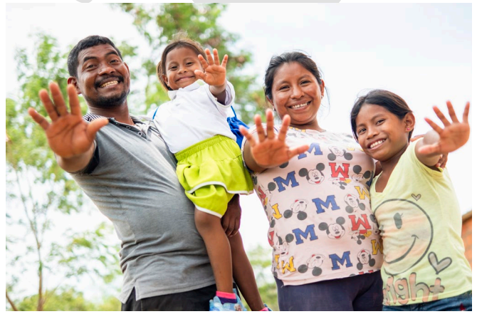
Una familia que participó en actividades de sensibilización en temas de higiene