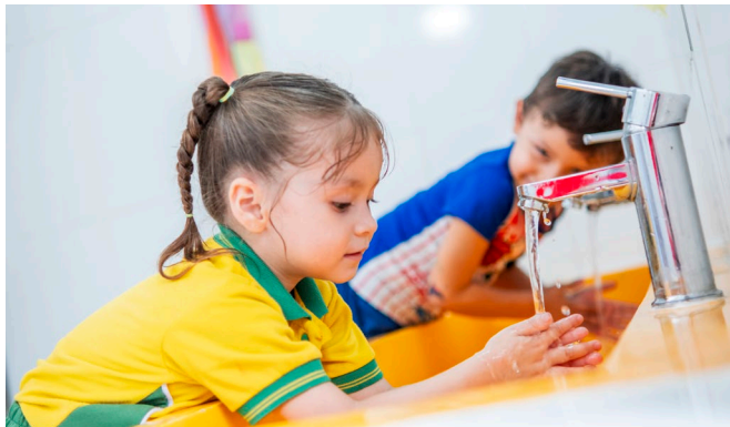
Sesiones de sensibilización del Día Mundial del Lavado de Manos